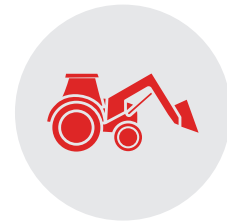
LA PERTE DES HABITATS (la perte de forêts matures, la conversion des terres et l'expulsion de chauves-souris de bâtiments)