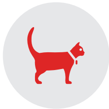
LES CHATS DOMESTIQUES