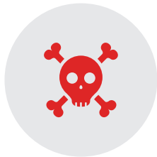
LE SYNDROME DU MUSEAU BLANC (une maladie introduite par des humains)